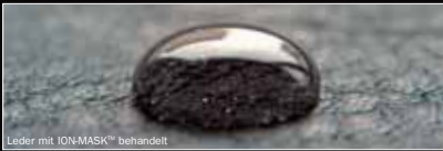
Leder mit ION-MASK™ behandelt

Der Plasma-Prozess ermöglicht den Polymeren auf submikroskopische Weise in den Schuh einzudringen. Das bedeutet, dass jede einzelne Faser mit einer Schicht wasserabstoßender Polymere molekularer Größe umgeben und damit umhüllt ist.